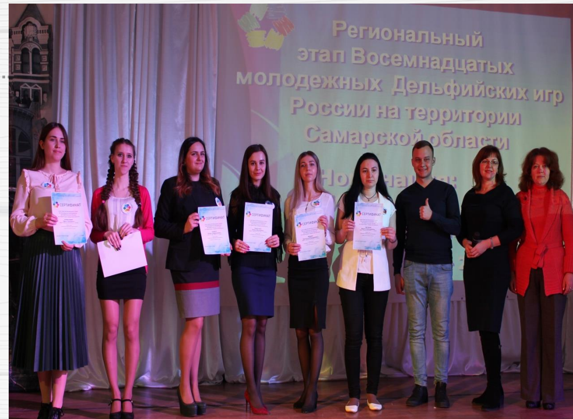
Лауреаты 3 степени