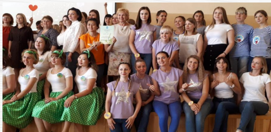
Городская игра «Педагогический старт» среди молодых педагогов Победители